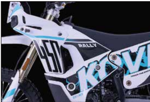
TANKINHALT 15 LITER RÉSERVOIR DE 15 LITRES