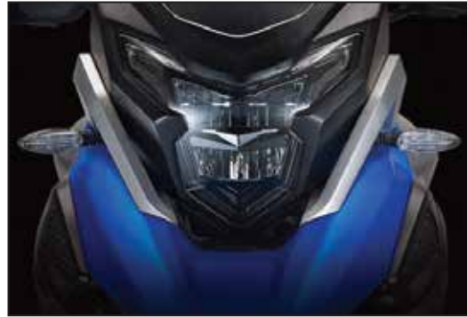
KOMPLETTE LED LICHTANLAGE ÉCLAIRAGE FULL LED