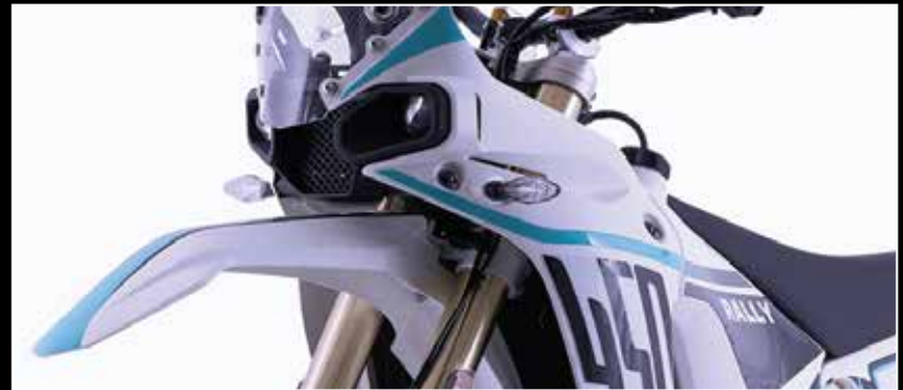
WEISS-HIMMELBLAU BLANC-BLEU CIEL