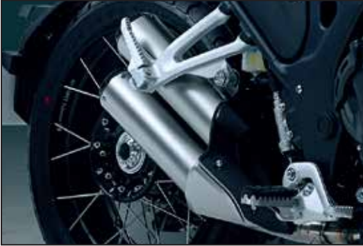
INOX AUSPUFFROHR ÉCHAPPEMENT INOX