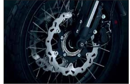
NISSIN BREMSE MIT ABS FREINS NISSIN AVEC ABS