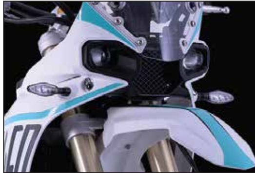
KOMPLETTE LED LICHTANLAGE ÉCLAIRAGE FULL LED