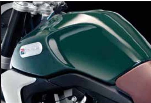
TANKINHALT 18 LITER RÉSERVOIR DE 18 LITRES