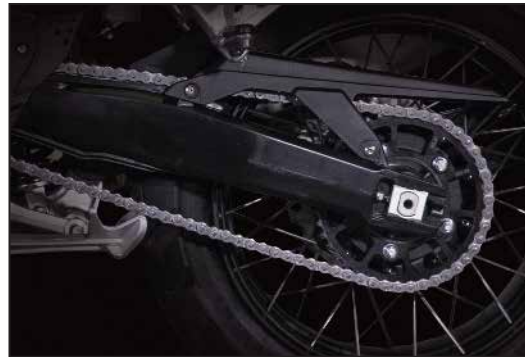
AFAM QUALITÄTSKETTE CHAÎNE DE QUALITÉ AFAM