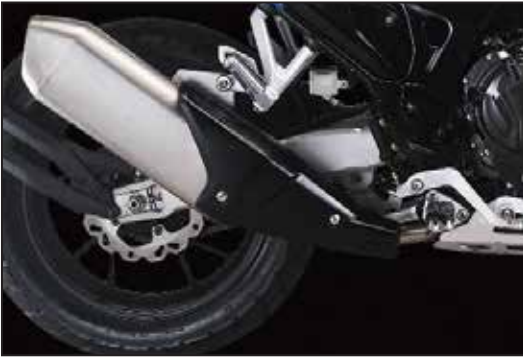
INOX AUSPUFFROHR ÉCHAPPEMENT INOX