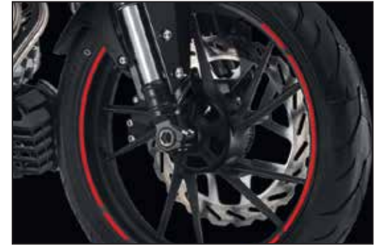
NISSIN BREMSE MIT ABS FREINS NISSIN AVEC ABS