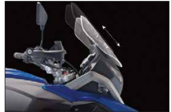
VERSTELLBARE SCHEIBE PARE-BRISE RÉGLABLE