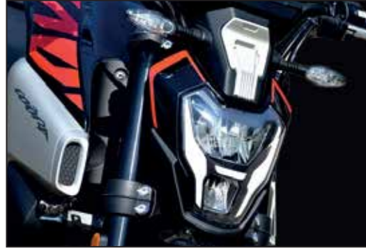
KOMPLETTE LED LICHTANLAGE ÉCLAIRAGE FULL LED