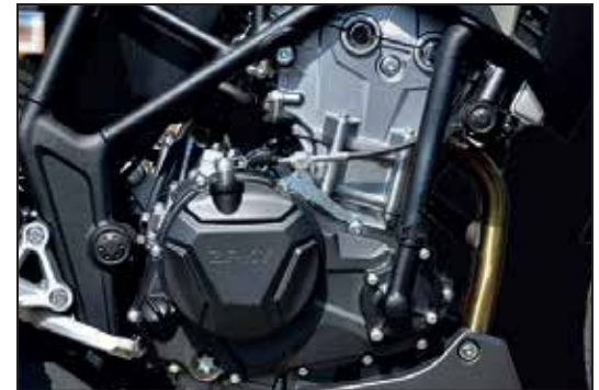
LEISTUNGSFÄHIGER 322 CC-MOTOR PUISSANT MOTEUR 322 CC