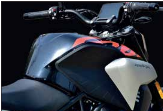
TANKINHALT 13 LITER RÉSERVOIR DE 13 LITRES