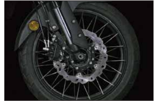
NISSIN BREMSE MIT ABS FREINS NISSIN AVEC ABS