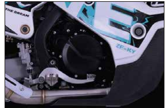
LEISTUNGSFÄHIGER 449 CC-MOTOR PUISSANT MOTEUR 449 CC