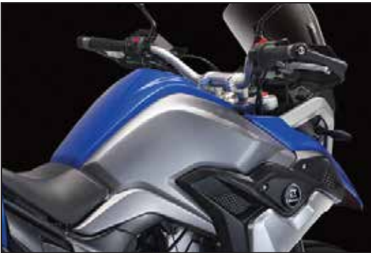
TANKINHALT 21 LITER RÉSERVOIR DE 21 LITRES