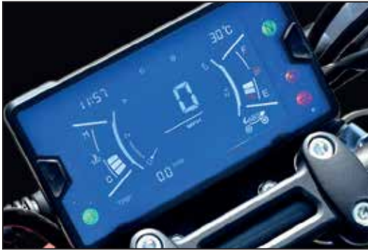
LCD-DISPLAY ÉCRAN COULEUR LCD