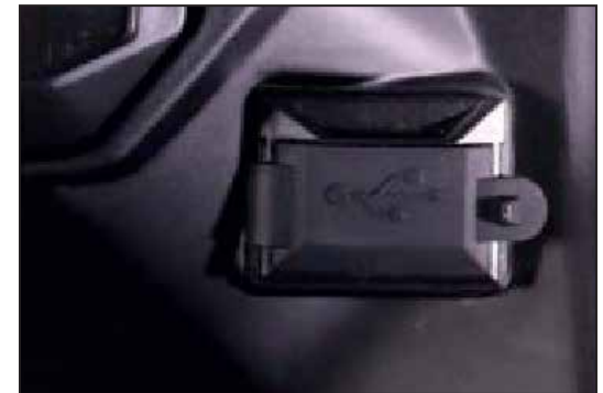
USB STECKER CONNECTEUR USB