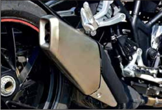
INOX AUSPUFFROHR ÉCHAPPEMENT INOX