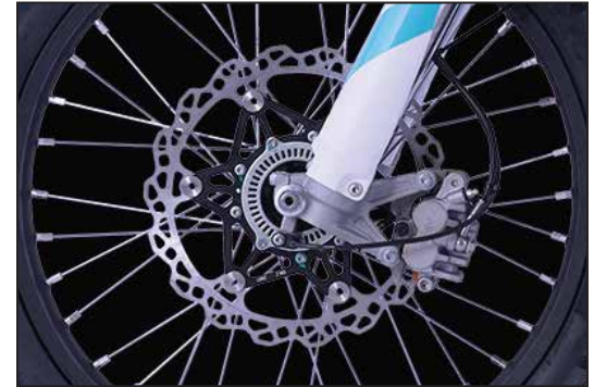
TASKO BREMSE MIT ABS FREINS TASKO AVEC ABS