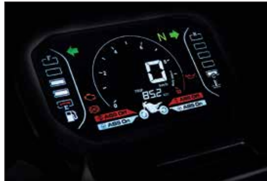
LCD-DISPLAY ÉCRAN COULEUR LCD