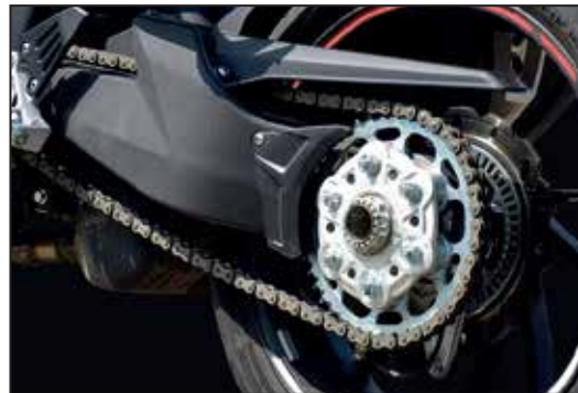
AFAM QUALITÄTSKETTE CHAÎNE DE QUALITÉ AFAM