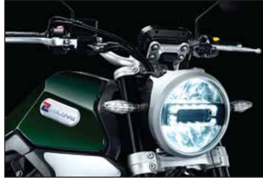
KOMPLETTE LED LICHTANLAGE ÉCLAIRAGE FULL LED