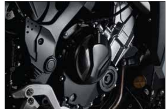
LEISTUNGSFÄHIGER 471 CC-MOTOR PUISSANT MOTEUR 471 CC