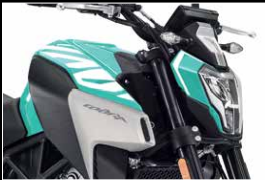
WEISS-HIMMELBLAU BLANC-BLEU CIEL